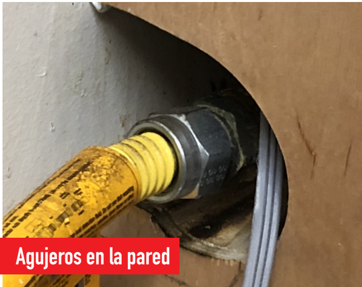
Agujeros en la pared